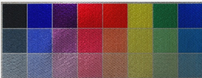
Foto 3: Dank MULTIDECOR können Folienbehänge nach Kundenwunsch koloriert werden