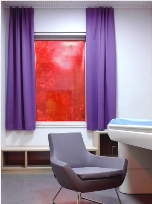
Foto 1: Im St. Olavs Hospital Trondheim schützen braunrote Folienrollos die lichtempfindlichen Patienten